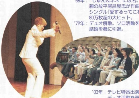
ノリノリで“合いの手”が入る