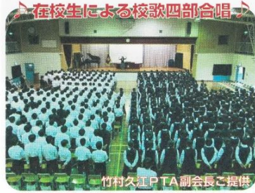
在校生による校歌四部合唱

雨天時の開催にも慣れてきて、「さつま芋」は事前に計量して袋に詰め、準備万端で臨みました。