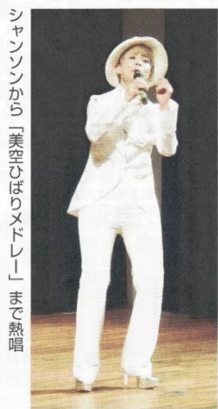
シャンソンから「美空ひばりメロデー」まで熱唱