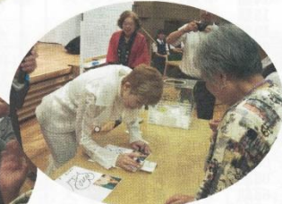
福引抽選会にも参加し当選者へサイン入り色紙をプレゼント