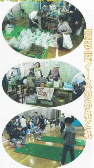
同窓会ブースのあれこれ