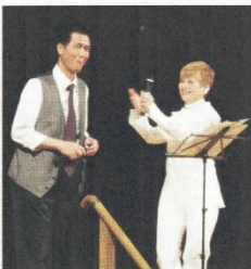
デュエット曲を披露