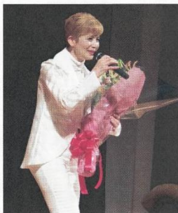
終演に際し贈呈された花束を手に感謝の言葉