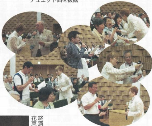
マイク持たせりや皆うたう!!!